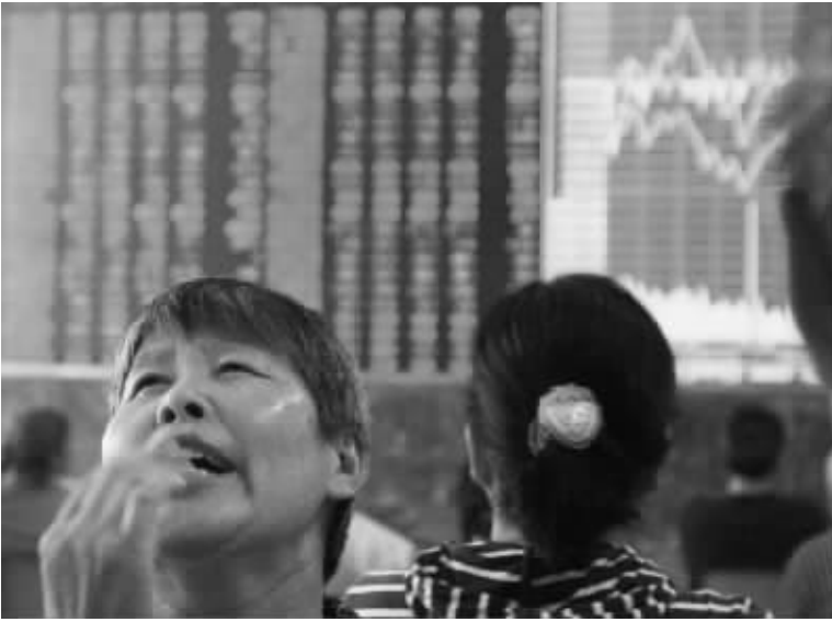
本周题材股的持续活跃和滞涨蓝筹股的崛起较好维系了做多人气 本报传真图

针对后市,机构认为,金融等大盘蓝筹股能否维持强势,对未来市场强弱以及攻击2600点上方阻力十分关键。事实上,大盘蓝筹股的整体发力,也再度揭示了市场主力目前重点依靠蓝筹股作为近期做多主线的思路。总体而言,蓝筹股的上涨说明市场还存在做多的动力,短期股指回调的空间也将因此变得有限,但下周初市场在上升压力线附近还会有一定的震荡争夺。